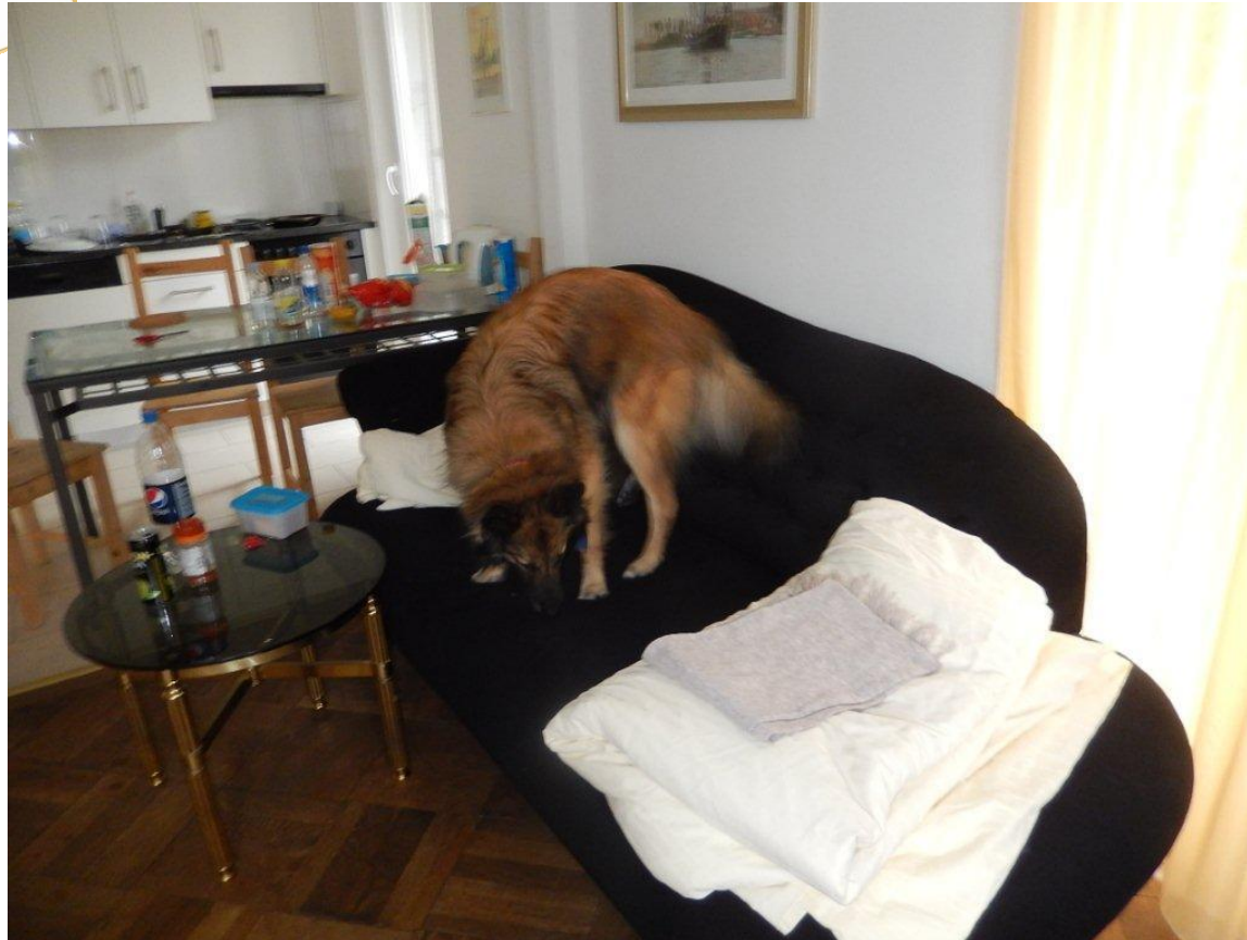
Nachkontrolle nach Bekämpfung Y'Chaya kontrolliert nach einer Bekämpfung